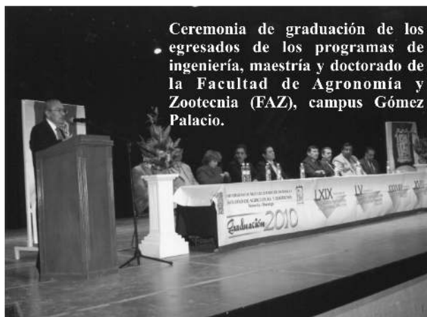
Ceremonia de graduación de los egresados de los programas de ingeniería, maestría y doctorado de la Facultad de Agronomía y Zootecnia (FAZ), campus Gómez Palacio.