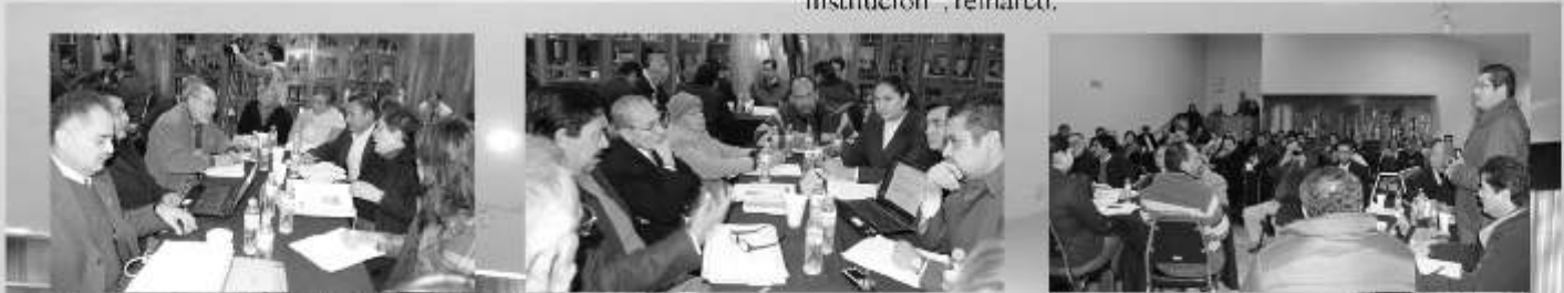
Cabe mencionar que es intención de esta Rectoría que en lo futuro, y en la medida de las posibilidades, se eviten todo tipo de violaciones a los Contratos Colectivos de Trabajo, y señalar que en el periodo de negociaciones sindicales que acaba de pasar, surgió la propuesta de realizar tres reuniones anuales, tentativamente una en mayo, otra en agosto y finalmente en noviembre, con la idea de prevenir posibles violaciones a los derechos de los trabajadores.