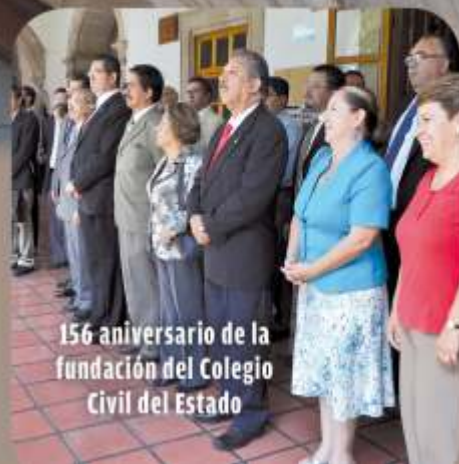
156 aniversario de la fundación del Colegio Civil del Estado