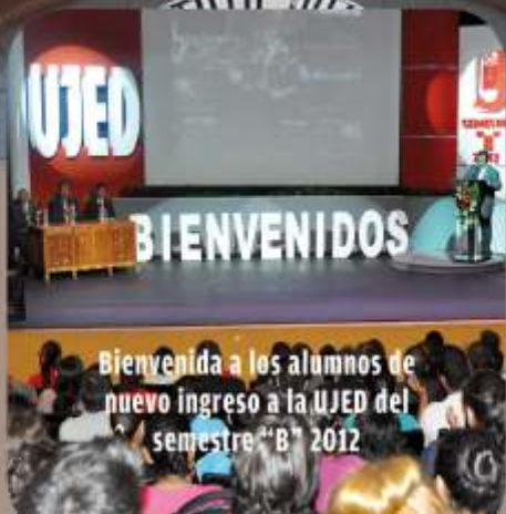
Bienvenida a los alumnos de nuevo ingreso a la UJED del semestre "B" 2012