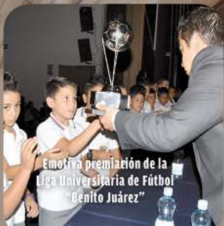
Emotiva premiación de la Liga Universitaria de Fútbol "Benito Juárez"

Cumple la UJED en tiempo y forma con el informe de recursos ejercidos del PIFI 2011