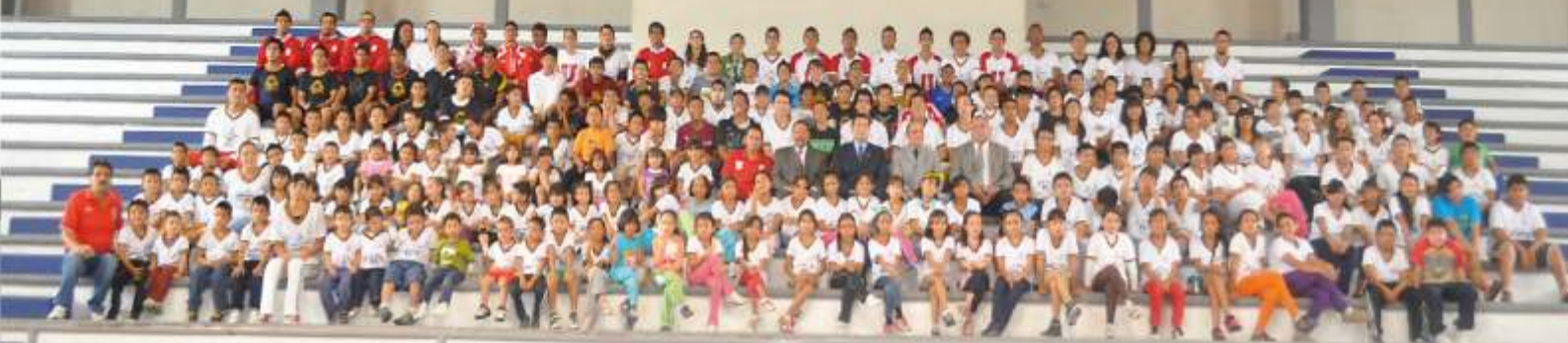
Foto oficial con los niños del Curso de Verano impartido por el CEDDU